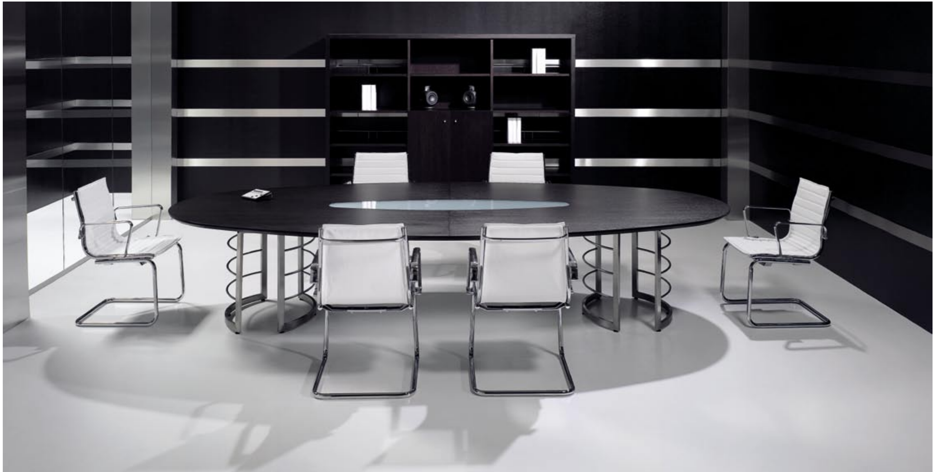
02. ▶Mesa oval com tampo em madeira e vidro fosco com pernas em aço inox. Armário em madeira com abertura central e portas batentes com base em tubo de aço inox. Cadeiras Light ▶Oval shaped table, veneer top, frosted glass application, stainless steel legs. Veneer cabinet, open centre and hanging doors, stainless steel frame structure. Light chairs