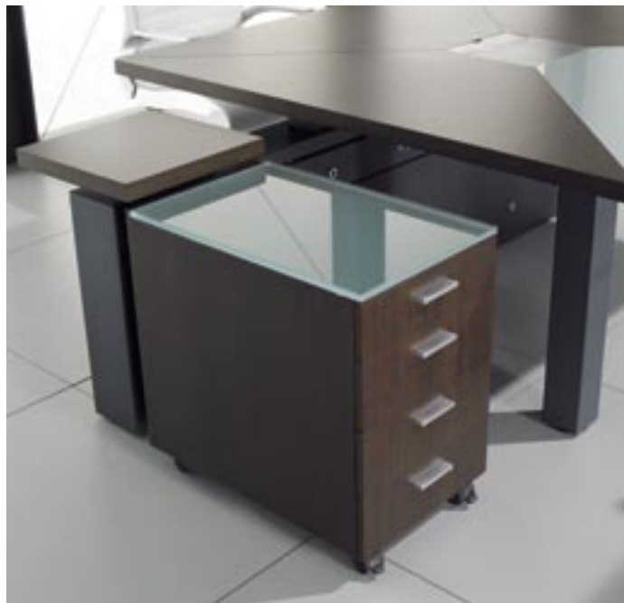
09. ▶ Bloco rodado em madeira com 4 gavetas, tampo em vidro fosco de 15 mm ▶ Veneer mobile pedestal, 4 drawers, 15mm frosted glass top ▶ Bloque rodante en madera con 4 cajones, tapa en cristal butiral de 15 mm ▶ Caisson à roulettes en bois avec 4 tiroirs, top en verre opaque de 15mm