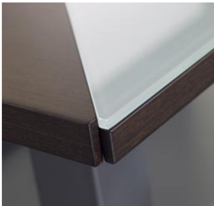
11. ▶ Tampo em madeira e vidro laminado fosco ▶ Veneer and frosted glass top ▶ Tapa en madera y cristal laminado butiral ▶ Plateau en bois et verre laminé opaque