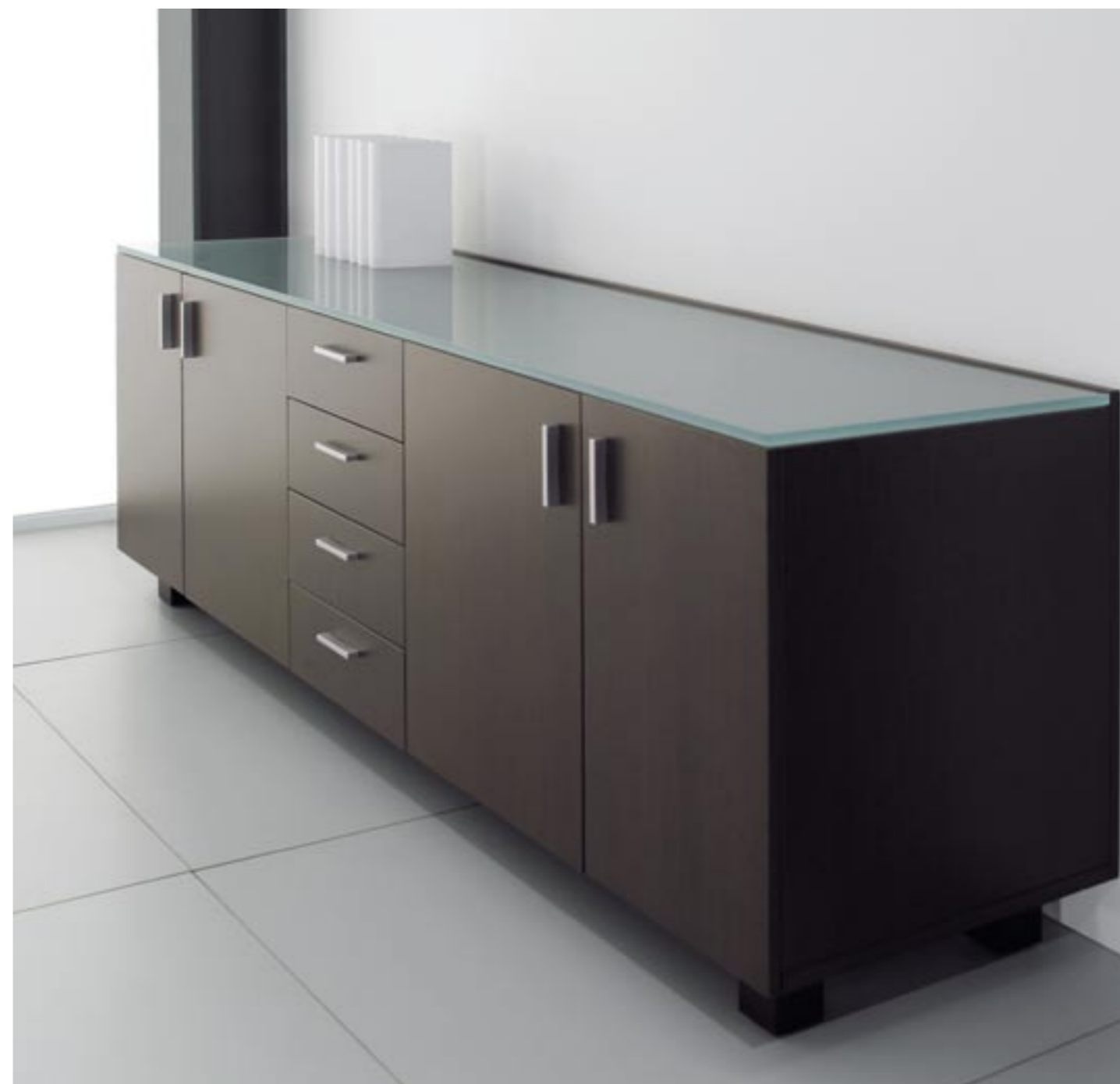
13. ▶ Armário baixo em madeira com 4 gavetas ao centro e 2 pares de portas batentes com tampo em vidro fosco de 15 mm e pés metálicos ▶ Veneer cabinet with 4 centred drawers and 2 sets of hanging doors, 15mm frosted glass top, metallic feet ▶ Armario bajo en madera con 4 cajones en el centro y 2 pares de puertas batientes con tapa en cristal butiral de 15 mm y pies metálicos ▶ Armoire basse en bois de 4 tiroirs au centre et 2 paires de portes battantes, avec top en verre opaque de 15mm et pieds métalliques