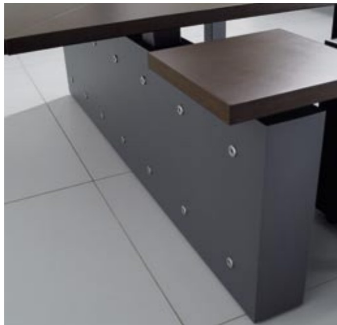
10. ▶ Aplicações em aço inox no painel da estrutura ▶ Structural panel with stainless steel applications ▶ Aplicaciones en acero inox en el faldón ▶ Applications en inox sur le panneau de la structure